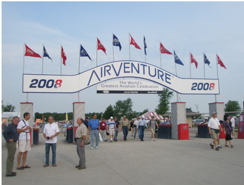
der Eingang zum Festgelände

Nächster Tag, Dienstag. Tagwache war um 6 Uhr, nach einem gemütlichen Kaffee stürzten wir uns in den großen Trubel mit tausenden Menschen und Flugzeugen, angefangen vom Segelflugzeug, bis hin zu modernsten Militärjets.